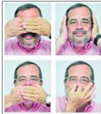
Veterana "cabecera" de El Cotarro a partir de hoy, solo en versión digital